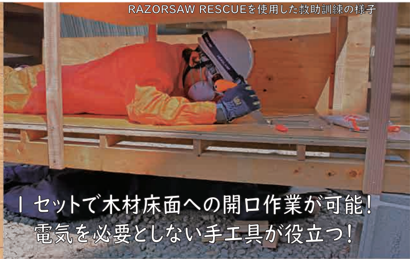
RAZORSAW RESCUEを使用した救助訓練の様子